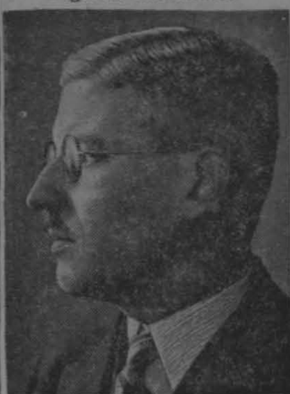
Dr. Kurt von SCHUSCHNING

Sucesor de Dollfus en la Cancillería austriaca. Sigue idéntica política que aquel en combatir a todo trance las influencias marxistas y nazistas en Austria, no siendo tampoco partidario de restaurar por ahora la dinastía de los Hapsburgo.